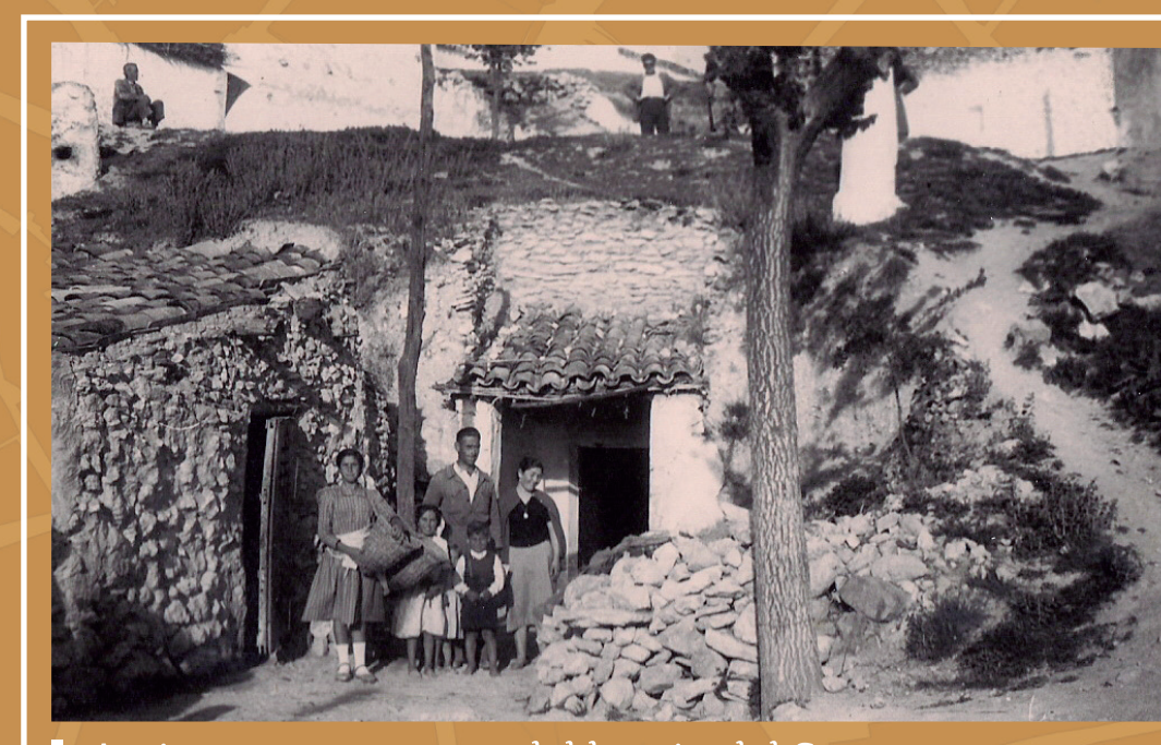
Antiguas casas-cueva del barrio del Santo

¿Pudo ser el refugio de la mano de obra el origen? No hay que olvidar que para las construcciones señaladas se precisaba ciertas “habilidades del conocimiento” no disponibles localmente.