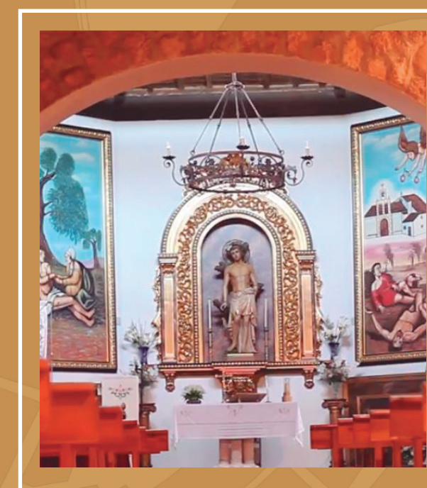
Ermita y talla de San Sebastián