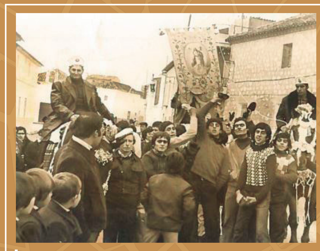
Plaza del Carmen, con la ermita al fondo, año 1976