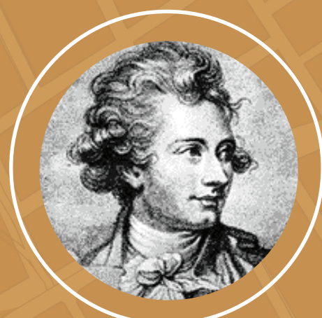
Vincenzo Lunardi aeronauta italiano