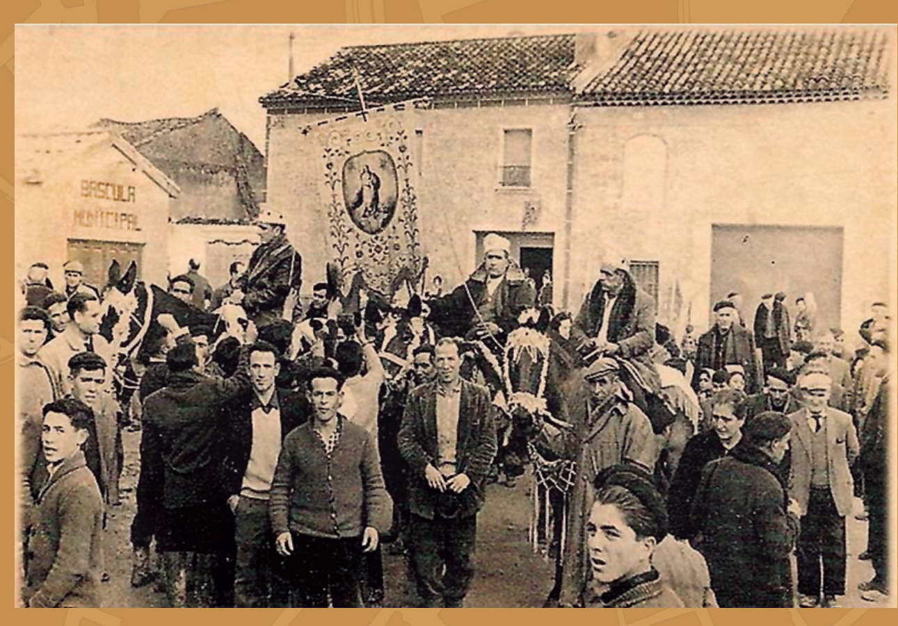
Plaza del Carmen y Báscula Municipal, año 1963

La ermita del Carmen, además de su función religiosa topográficamente fue el elemento visual de la bifurcación entre el tradicional camino de Corral y el trazado de la nueva carretera que uniría Horcajo con Lillo y Orgaz.